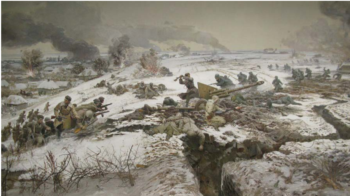
Діорама «Бій біля с. Соколове 8 березня 1943 року»: О. Ярош веде 1-шу роту 1-го ОЧПБ в атаку (з експозиції Зміївського краєзнавчого музею)