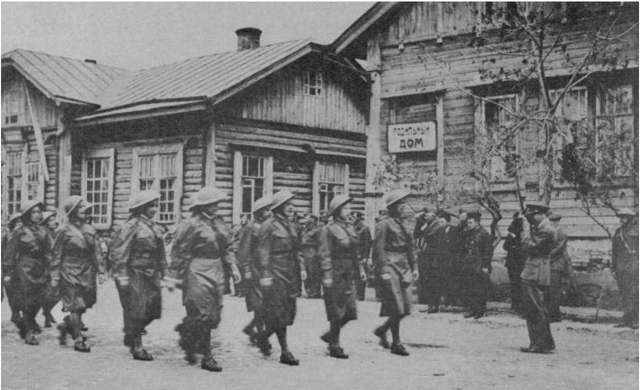
1-й ОЧПБ (м. Бузулук, лютий 1942 р.) [2, 165]