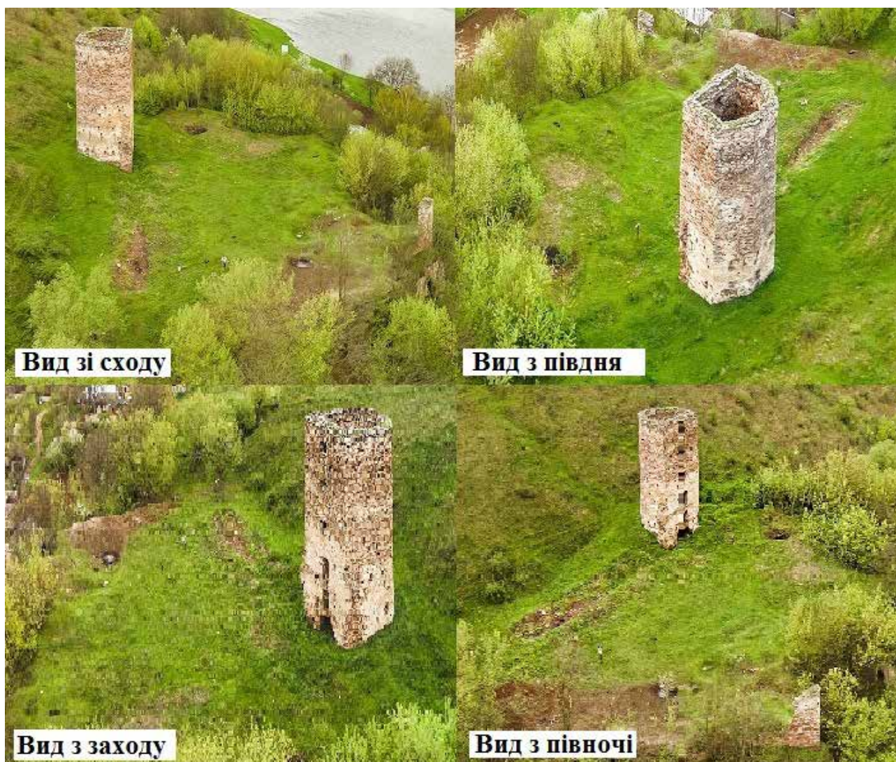
Рис. 1. Раковецький замок.

ського геоморфологічного району, для якого характерні карстові форми рельєфу, глибокі річкові долини та горбисто-хвилясті покутські височини (рис. 1). А прилегла до замкового комплексу територія – це природна зона Дністровського каньйону, що є унікальним геологічним утворенням на базі комплексу осадових товщ від найдавніших (силурійських) до наймолодших (антропогенних) відкладів. Замкова площа (висота території коливається від 192 до 207 м) знаходиться біля підніжжя гори й відрізняється різким зниженням абсолютної висоти місцевості в сторону річища Дністра (до 170 м) і збільшенням при підйомі на схил (до 280 м над рівнем моря).