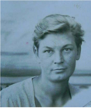
Фото 1. Є.Ф. Богданова. ДАМО. – Ф. Р-5859. – Оп. 1. – Спр. 1918. – Арк. 4 зв.

з виробництва [15, 16 зв.]. Про їхню долю можна лише здогадуватись.