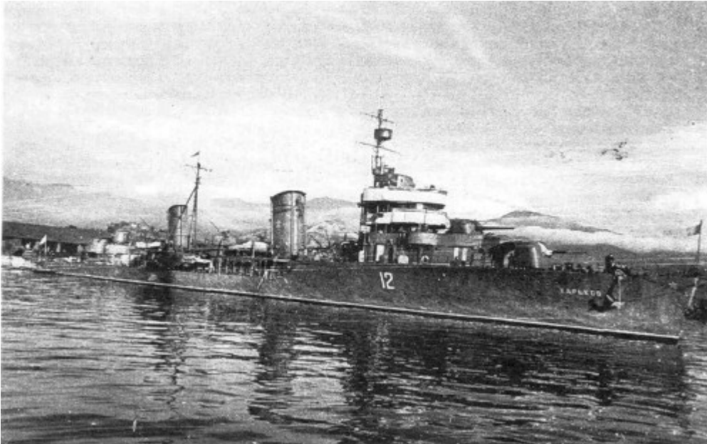
Мал. 2. Лідер «Харьков»

крейсера «Ворошилов» і лідера «Москва» (загальне командування покладалося на командира загону легких сил ескадри контр-адмірала Т.А. Новікова). Однак ближче до вечора 25 червня Головне командування ВМФ внесло зміни до плану: ударна група тепер складалася з двох лідерів, а група прикриття – з крейсера й есмінців [16].