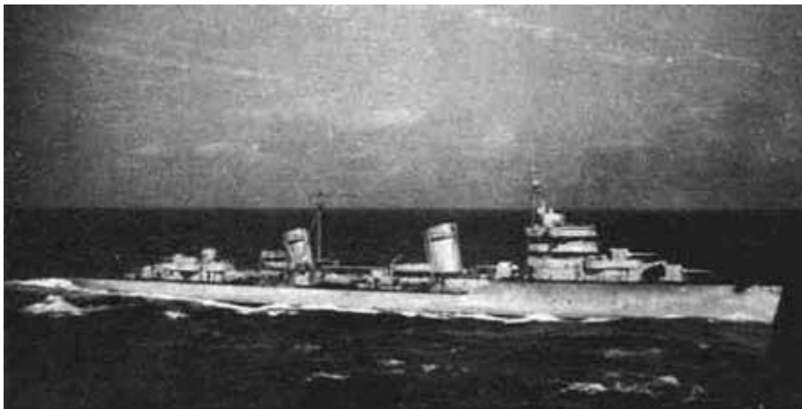
Мал. 1. Лідер «Москва»

У працях зазначених авторів міститься критика плану операції радянського військово-морського командування: поразка з великими втратами стала результатом неправильного її планування. Зокрема, втрачено лідера есмінців «Москву», ушкоджено лідера «Харьков». Порт Констанца продовжив роботу в звичайному режимі.