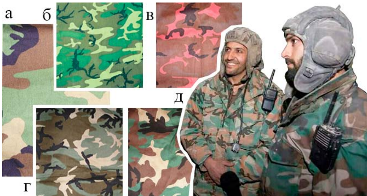
Рис. 4. Камуфляжі САА американського типу: а. Шаблон армії США «Woodland» («Лісовий»); б. Шаблон армії США «ERDL» («Листя»); в. Версія «Pink syrian leaf» («Рожеве сирійське листя») для елітної військової поліції та сил безпеки САА; г. Версії загальновійськового камуфляжного шаблону «Syrian leaf» [20]; д. Танкісти ЗС Сирії у камуфляжах «Syrian leaf» (аналогі американських шаблонів «ERDL» та «Woodland») [21]

війська Сирії. Однак, на відміну від американського «ERDL Pattern», у версіях «Syrian leaf» використовують іншу колірну схему, і, крім того, уніформу САА виготовляють із щільної бавовняної тканини.