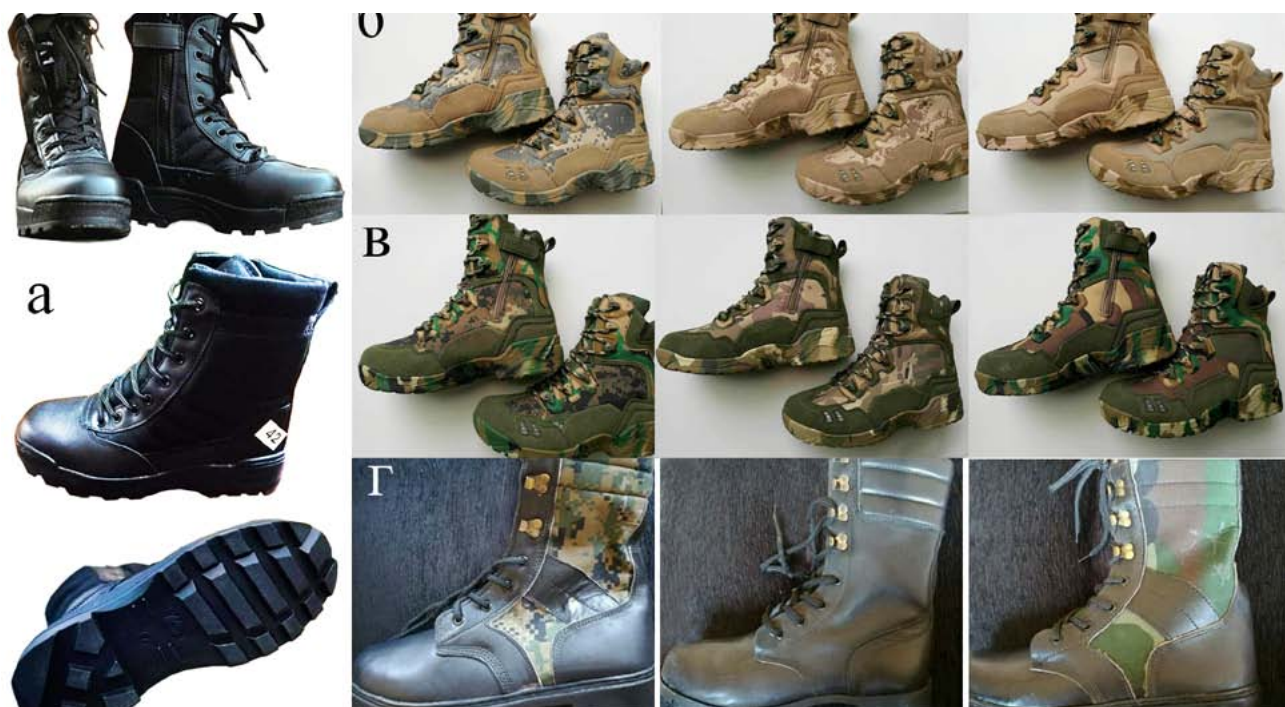
Рис. 6. Взуття, яке постачає сирійська фірма «Marinz» для САА: а. Штатні чорні армійські берці; б. Берці для бойових дій у пустелі; в. Взуття для використання в місцевості з рослинним покривом; г. Спеціальне взуття для виконання бойових завдань у складних умовах та агресивному середовищі [37]

Серйозною проблемою, з якою зіткнулася САА в ході війни, стало використання її одностроїв бандформуваннями та терористами під час здійснення терористичних актів, злочинів, грабежів, викрадання людей. Причиною став вільний доступ до придбання зброї, штатного військового обмундирування та спорядження через мережу комерційних фірм, приватних магазинів і ринків, особливо в Хаджі та Дамаску, а також відсутність контролю за цим процесом із боку держави й армії. Тому в червні 2015 р. уряд Сирії ухвалив «Резолюцію про військове обмундирування, спорядження і продаж зброї та озброєнь». Одним із важливих її положень є заборона на продаж військової форми всіх видів, аксесуарів, знаків розрізнення та військового спорядження приватному сектору й окремим фізичним особам. Був також обмежений імпорт камуфляжних тканин, військового одягу та спорядження, зокрема через міністерства оборони і внутрішніх справ. Через місяць всі магазини, що не припинили продаж військового майна без ліцензій і сертифікатів, були зачинені. Повсюдно сформували патрульні групи з представників армії, внутрішніх військ і сил безпеки на чолі з офіцером військової поліції для встановлення особи затриманих у військовій уніформі, зі зброєю, для контролю за роботою державних та приватних магазинів, швейних майстерень і кравців, а також вжиття відповідних судових заходів проти порушників [38].