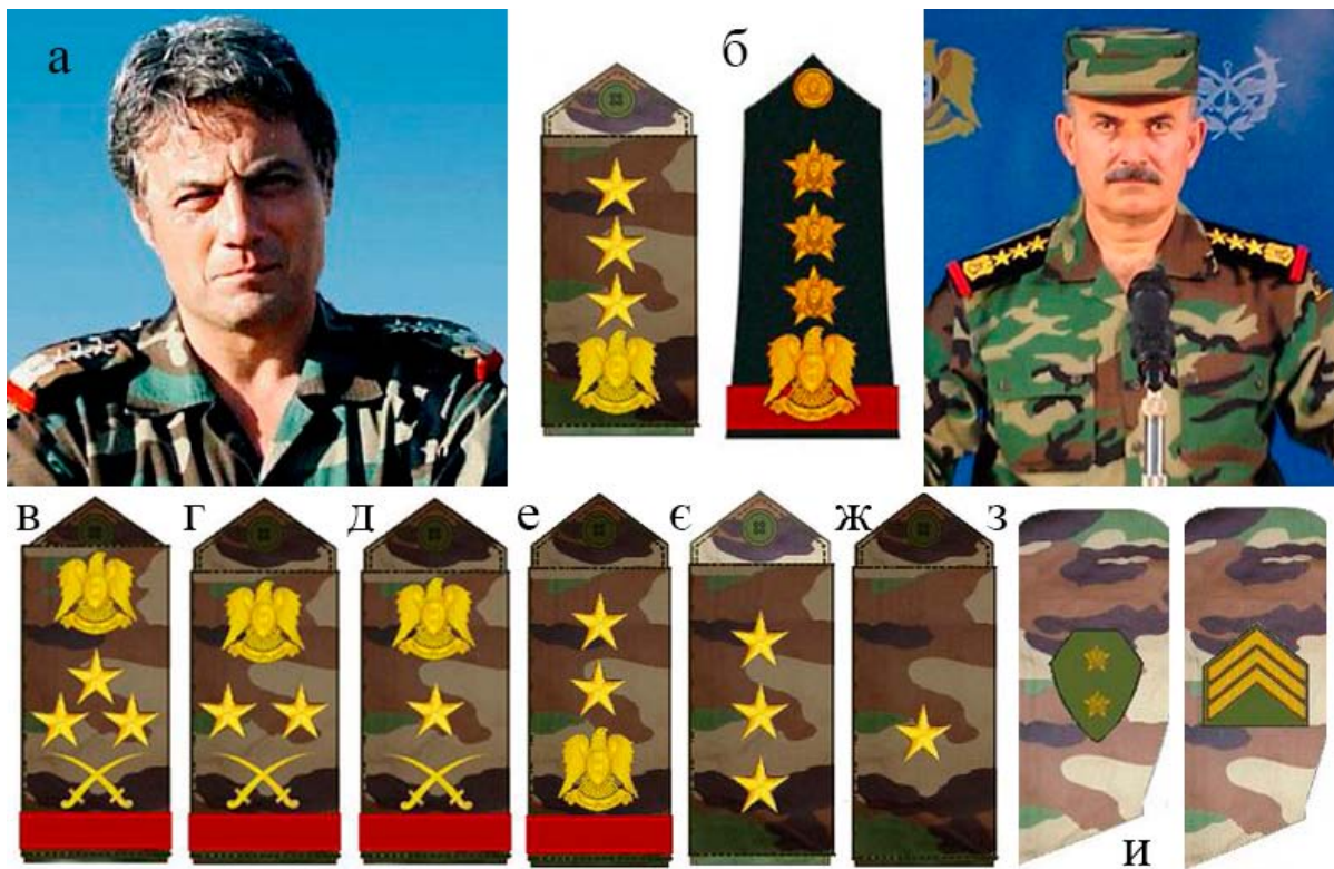
Рис. 1. Деякі знаки розрізнення САА і їх розміщення на бойовому обмундируванні: а. Бригадний генерал Манаф Талсс, колишній помічник президента Сирії Башара аль-Асада (у польовому однострої) [14]; б. Бригадний генерал Алі Майхоуб, прес-секретар сирійської армії (з погонями ВМФ на польовому однострої) [15]; в. Мушир (маршал, приватне звання президента Сирії Башара аль-Асада); г. Ферік авваль (генерал-полковник); д. Ферік (генерал-лейтенант); е. Акід (полковник); е. Накіб (капітан); ж. Мулязім (лейтенант); з. Мусайд авваль (старший прапорщик); и. Ракіб авваль (старший сержант) [13]

Один із перших камуфляжних шаблонів в обмундирування сирійської армії впроваджений у 70-х роках ХХ ст. Це була сирійська копія пакистанського шаблону «Brushstroke» («Мазок пензля», «Рух пензля», «Мазок»), який став основою вітчизняних тканин і уніформи для кількох десятиріч (рис. 2). Камуфляж «Brushstroke» – один із перших базових британських шаблонів у світі, на основі якого змодельовано безліч інших варіантів. Його винахід належить майору British Armed Forces Мервіну Деннісону, якому в 1941 р. під час Другої світової війни спало на думку використати велику щітку (за зразком швабри) для камуфлювання штатного бавовняного (кольору хакі) комбінезона парашутистів, щоб посилити ефект маскування. Перші жовтувато-піщані саржеві зразки уніформи десантників були розписані вручну широкими пензлями та щітками методом нанесення хаотичних зеленкуватих і темно-коричневих коротких смуг із використанням нестійких барвників. При такому забарвленні базовий піщаний колір зник під різнокольоровими мазками, а обмундирування набуло специфічного строкатого колориту. Було визнано, що цей шаблон найкраще підходить для північноафриканського та італійського ТВД (театру воєнних дій). У 1942 р. після вдоскона-