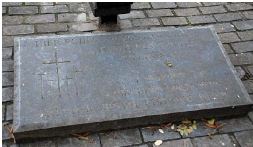
Кладовище на вул. Ризькій м. Києва