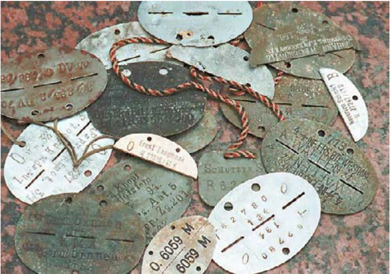
Солдатські жетони Вермахту