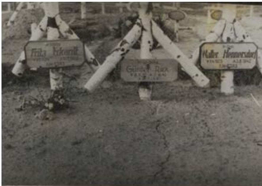
Надмогильний хрест.