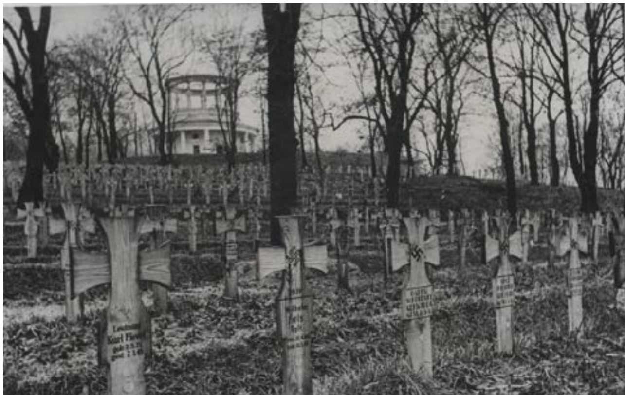
Кладовище героїв Вермахту № 1 біля Аскольдової могили (Фонди НМІУДСВ. – Ф-18951. – КН-122154)