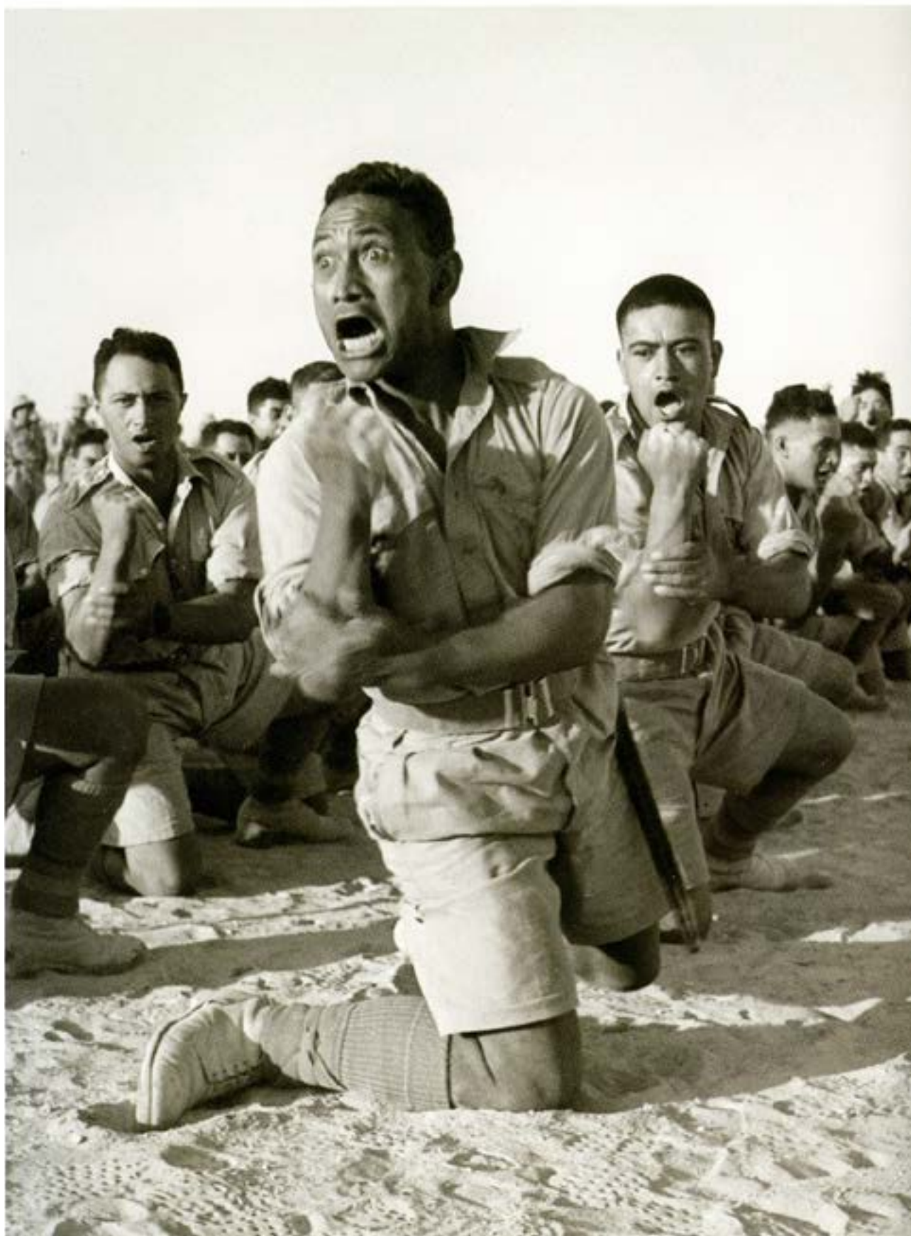
Батальйон маорі виконує гаку. Північна Африка, 1941 р.