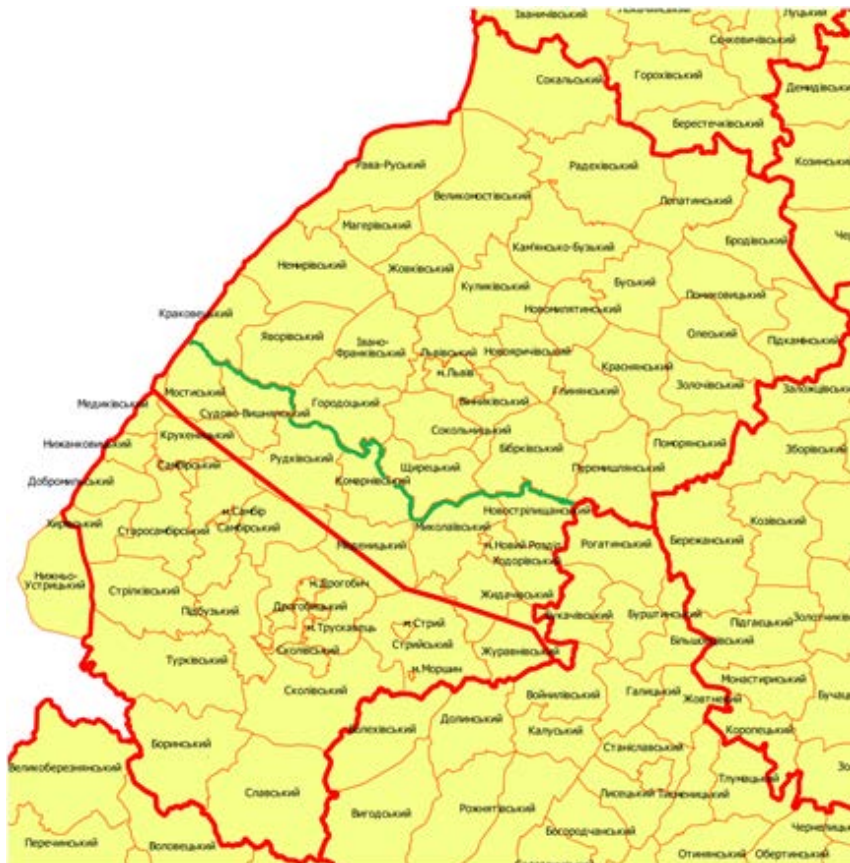
Невідповідність межі Львівської та Дрогобицької областей (червона лінія – хибна межа, нанесена програмістами, зелена – справжня межа).