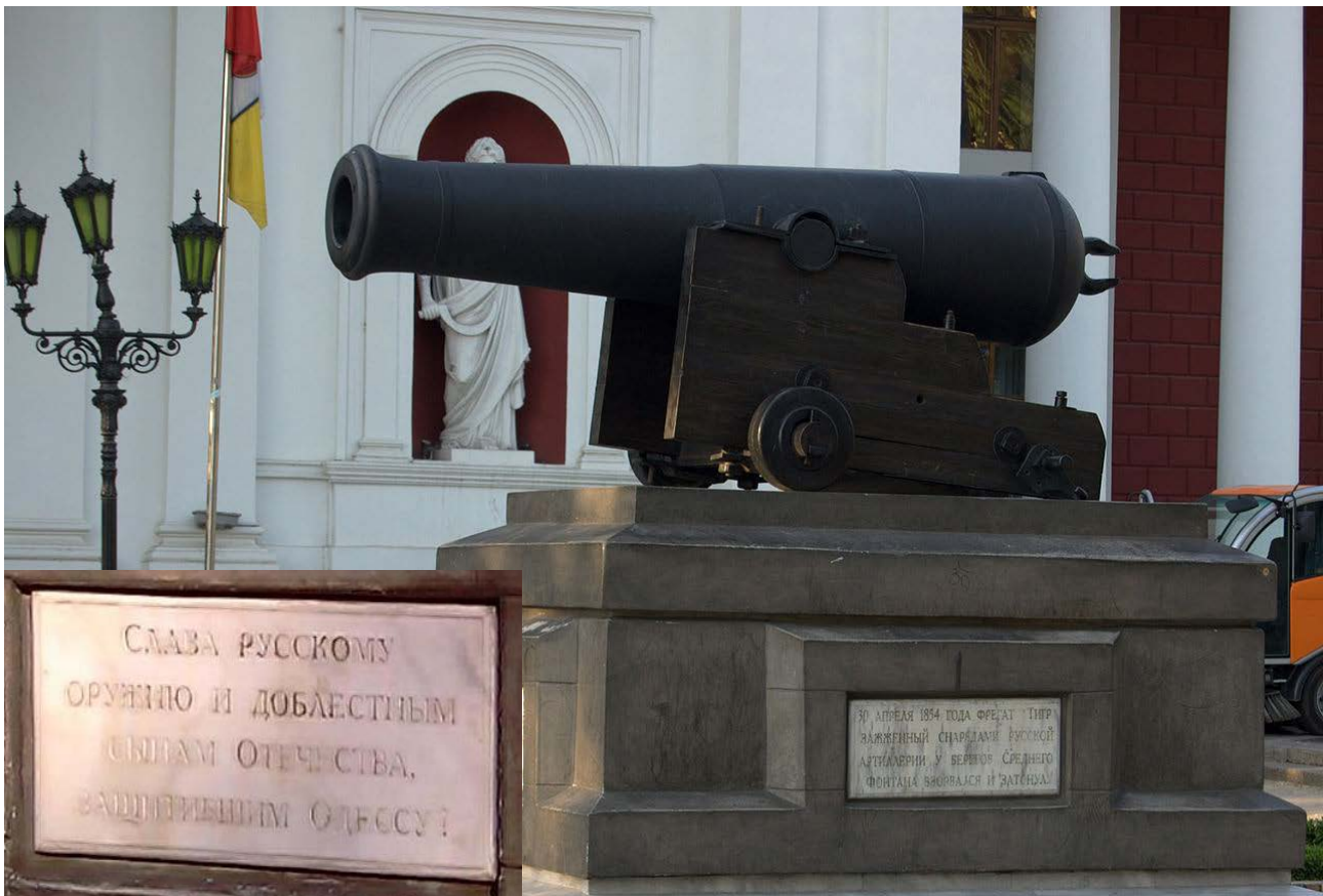
Рис. 5. Трофейна гармата з «Тигра» (Одеса, Думська площа).