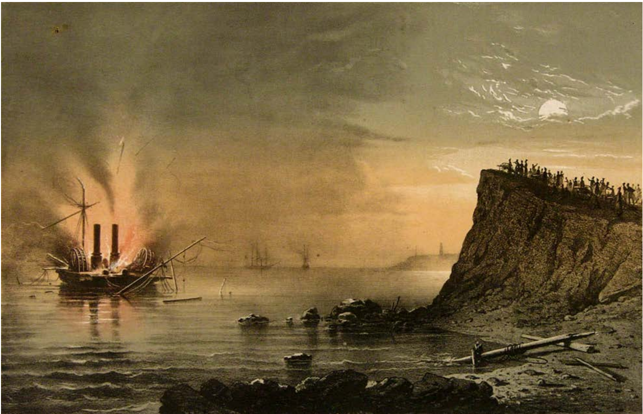
Рис. 3. «Взрыв сидящего на мели английского парохода-фрегата «Тигр» в виду других двух отбитых пароходов у хутора Кортаци, 30 апреля 1854 г.» (Літографія Ф.І. Гросса (1822 – 1897). Одеський краєзнавчий музей).

Слід зазначити, що дослідник М.І. Ленц спотворює початкові дії проти «Тигра» на користь командира 3-го піхотного корпусу генерал-ад'ютанта барона Д.Є. Остен-Сакена (24.04.1789 – 4.03.1881), переконуючи, що саме за наказом останнього непричетні до цього російські підрозділи прибули до «Тигра». Але це твердження спростовується принаймні двома фактами, а саме: тим, що Ф.І. Абакумов отримав догану від генерал-майора Є.І. Майделя (26.01.1837 – 20.03.1881) за те, що покинув Люстдорф без його дозволу, і тим, що серед усіх бойових російських підрозділів, які дислокувалися в Одесі, тільки дунайці 2-го козачого полку мали вишкіл до абордажного бою із судовими екіпажами ворога.